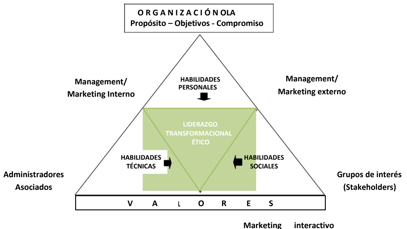
Gráfico Nº 1: Modelo de nueva gestión estratégica de OLA

En el gráfico se presenta el MLT en acción. El mismo consta de los siguientes elementos: la organización, el propósito, sus objetivos, el triángulo de habilidades, el liderazgo personal y los valores.